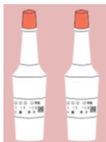
尿一次検査用容器(容量8ml)を2本