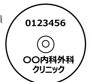
▲ディスク表面に直接、医療機関コードと医療機関名を記入して下さい。