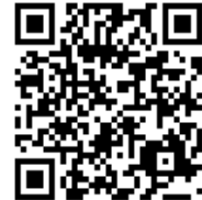
財団ホームページ QRコード